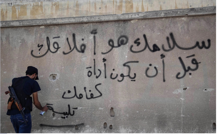
عدشة شاب حمصي